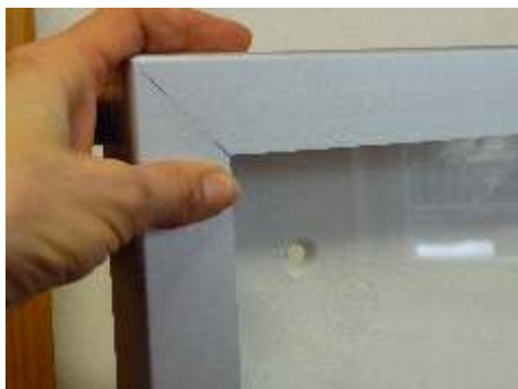
STAR Schaukasten mit Drehflügel, ab Größe DIN A0 öffnet der Schaukasten jedoch nach oben mit Gasdruckfedern