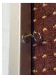
Schloss seitlich im Rahmenprofil, von vorn nicht sichtbar

* Pulverbeschichtung des Schaukastenrahmens und der Ständer nach RAL-Classik-Farbkarte (keine Perl- und Leuchtfarben)